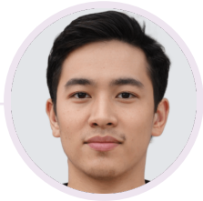
John Doe Founder & Co-CEO

Tincidunt semper feugiat nibh sed proin. Et ultrices neque ornare aenean.